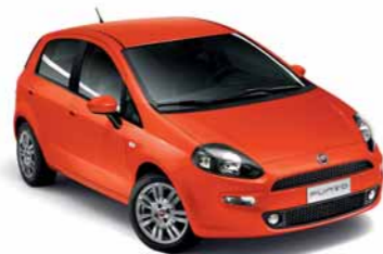
562 ARANCIO SICILIA* (extraserie)