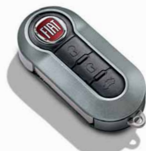
Grigio Titanio Opaco