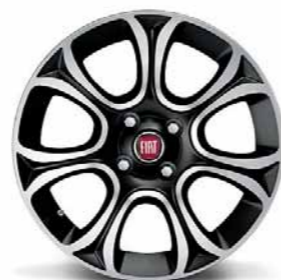
5FB Cerchi in lega da 16" diamantati nero lucido 195/55 R16 (non catenabili)