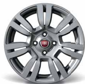
108 Cerchi in lega da 15" 185/65 R15