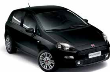
876 NERO TENORE*

* I colori esterni nella configurazione SPORT LOOK prevedono il tetto nero.