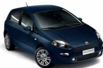
475 BLU RIVIERA