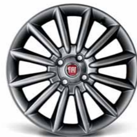
5A6 Cerchi in lega da 17" bruniti 205/45 R17 (non catenabili)