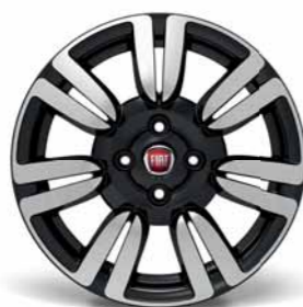
421 Cerchi in lega da 15" diamantati nero lucido 185/65 R15