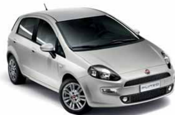
348 GRIGIO ARGENTO*