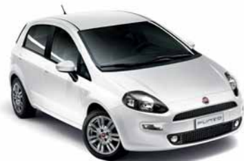
296 BIANCO GELATO* (extraserie)