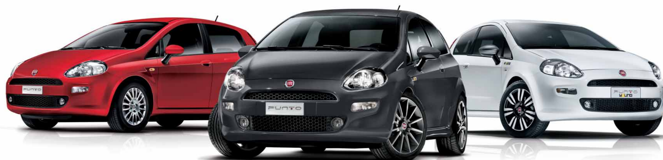
Punto Street, Punto Young e Punto Lounge per chi non vuole rinunciare a stile, funzionalità ed eleganza.