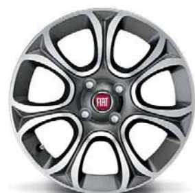
50902778 Cerchi in lega da 16" bruniti diamantati (Lineaccessori)