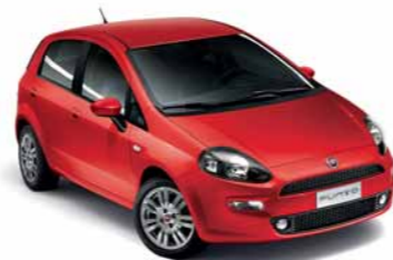
176 ROSSO PASSIONE* (extraserie)