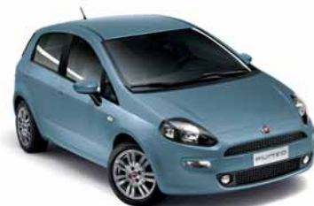
401 BLU SERENATA* (extraserie)