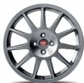
50902243 Cerchi in lega da 17" bruniti (Lineaccessori)