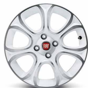
50902779 Cerchi in lega da 16" bianchi diamantati (Lineaccessori)