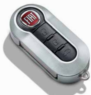
Grigio Argento Opaco