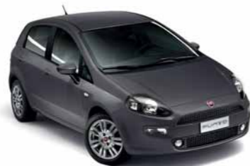
679 GRIGIO MODA*