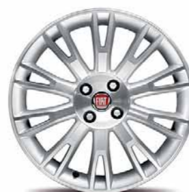
50901339 Cerchi in lega da 17" (Lineaccessori)