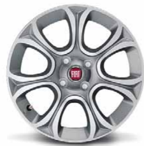
439 Cerchi in lega da 16" diamantati 195/55 R16 (non catenabili)