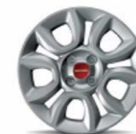
Coppe ruota 15" di serie su Panda Easy motorizzazione metano