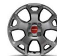
Cerchi in lega 15" bruniti opachi di serie su Panda Cross 4x4 e opt. a richiesta su Panda City Cross (opt. 108)