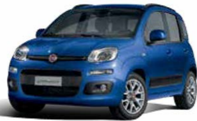
789 BLU GIOTTO PASTELLO