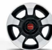
Cerchi in acciaio 15" di serie su Panda City Cross