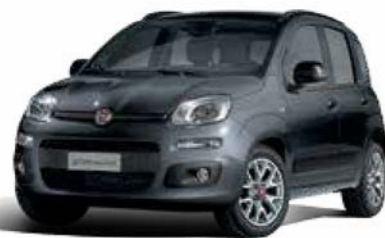
446 GRIGIO COLOSSEO METALLIZZATO