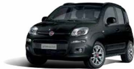
601 NERO CINEMA PASTELLO