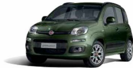
374 VERDE TOSCANA METALLIZZATO