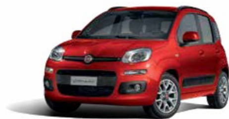
078 ROSSO AMORE PASTELLO