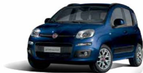
567 BLU MEDITERRANEO MICALIZZATO