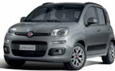
785 GRIGIO MODA PASTELLO