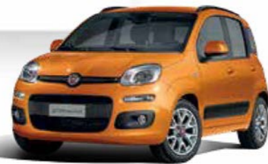
516 ARANCIO SICILIA PASTELLO