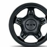
Cerchi in acciaio nero 15" con cover mozzo dedicato di serie su Panda 4x4