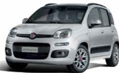
565 GRIGIO ARGENTO METALLIZZATO