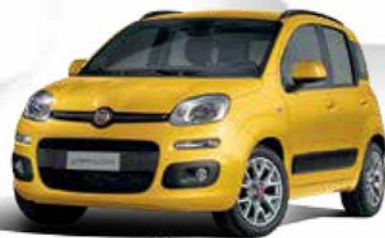
509 GIALLO SOLE PASTELLO