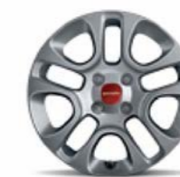
Cerchi in lega 14" di serie su Panda Lounge* (opt. 439)