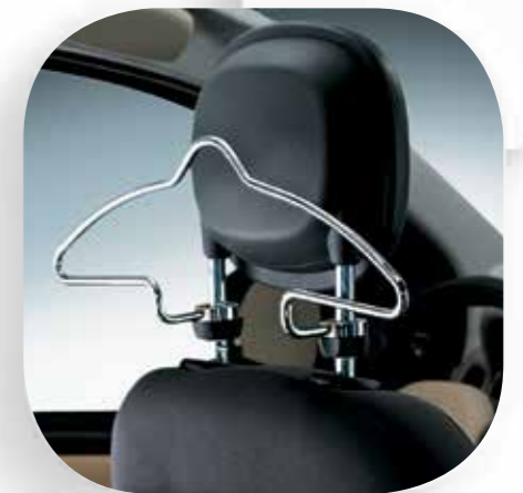
Appendigiacca su poggiatesta