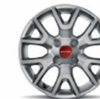
Cerchi in lega 15" Silver di serie su Panda Lounge motorizzazione metano (opt. 431)