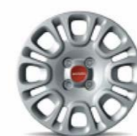
Cover ruota 14" di serie su Panda Easy