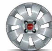
Coppe ruota 14" di serie su Panda Pop