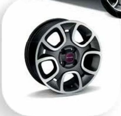
Cerchi in lega 15" colore grigio antracite/diamantato