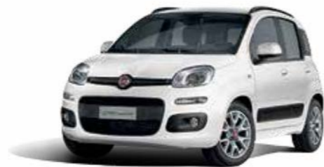
296 BIANCO GELATO PASTELLO