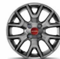
Cerchi in lega 15" bruniti opt. a richiesta su Panda 4x4 (opt. 420)